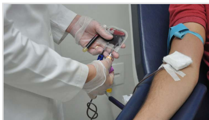
Surtos de gripe e dengue derrubam estoques de sangue em Ribeirão Preto

Com a chegada do outono, existem vários motivos para comemorar. A mudança de cor das folhas, o tempo mais frio, aquele cobertor antigo que é uma excelente companhia nas noites em casa. Porém, no Banco de Sangue de Ribeirão Preto, a mudança de estação é motivo de preocupação.