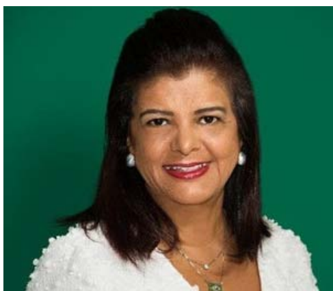
LUIZA TRAJANO