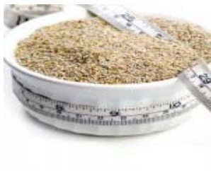
Quer perder peso rápido? Vá de chia