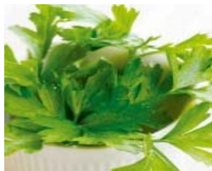
9 maneiras diferentes de usar a salsinha