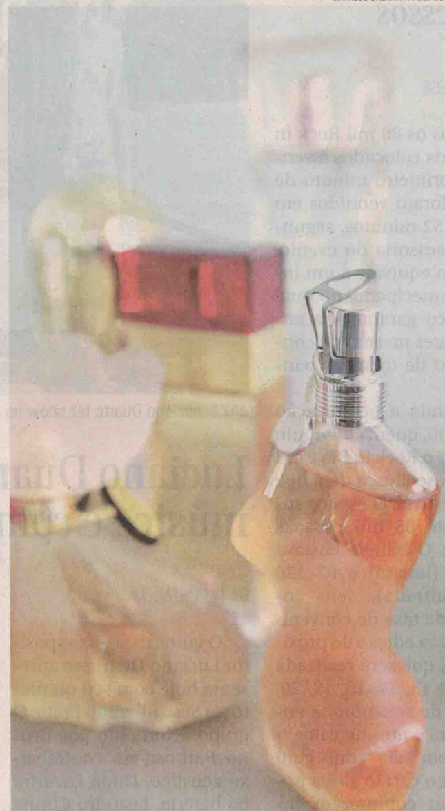
ETERNAS Alguns perfumes nacionais ou importados ultrapassam tendências e gerações. São composições clássicas que acompanham a evolução da mulher

para momentos de sedução. “Precisa chegar mais perto para senti-lo. Mas um bom perfume sempre atrai”, diz Veiga. A perfumista revela que algumas fragrâncias têm um caminho olfativo maior que tempera e aquece a relação.