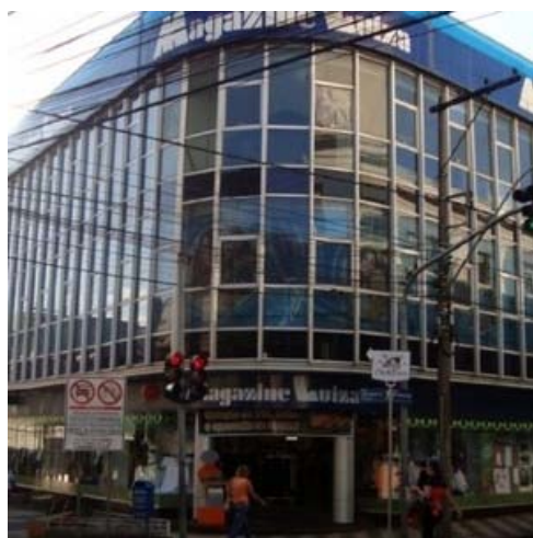
MAGAZINE LUIZA LANÇA SERVIÇO COM A CLARO