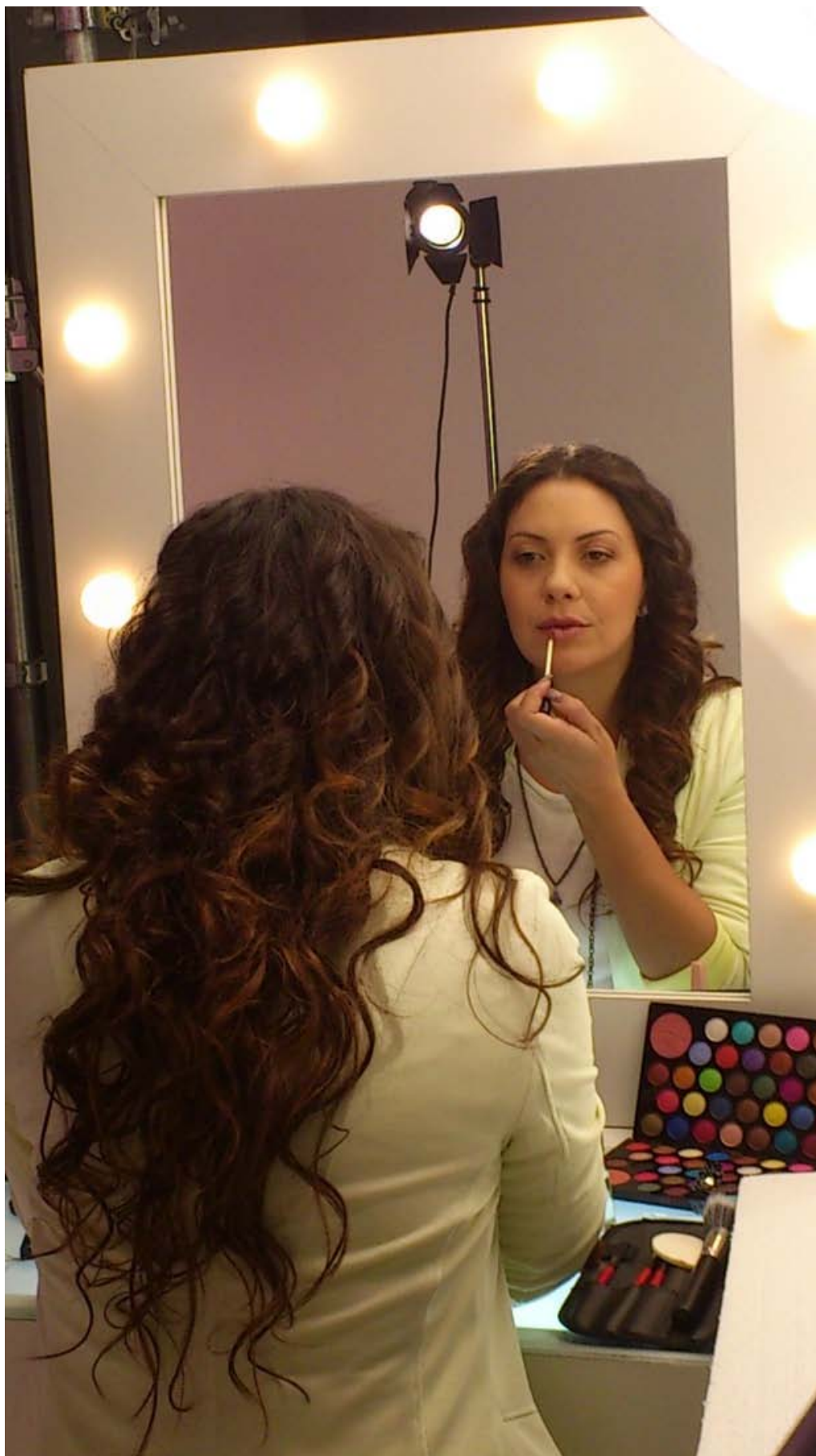
Em "Avenida Brasil" ela vive Olenka