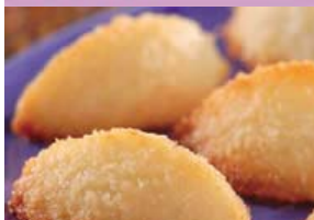
Cocada De Casquinha