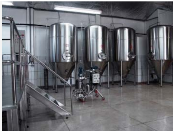
Invicta: Fábrica será aberta ao público em 24/8

“Somos apaixonados pelas cervejas artesanais e acreditamos no potencial deste mercado. Apenas para efeito de comparação, enquanto nos Estados Unidos e Europa este mercado representa entre 10% e 15% do total de cervejas comercializadas, no Brasil o índice está entre 1% e 2%”, justifica Silveira. Segundo o cervejeiro, os produtos da micro não conterão aditivos químicos nem outras fontes amiláceas que não sejam os próprios maltes. “Mensalmente, vamos produzir 15 mil litros de chope, mas temos condições de chegar até a 100 mil litros por mês”, afirma ele.